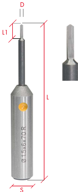
Art. 3.15.70.A Maßstab 1:1 Full size