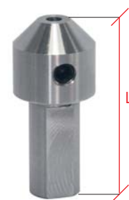
Art. 3.03.10 Maßstab 1:1 Full size