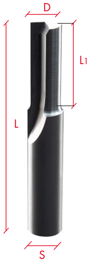
Art. 13.08.091 Maßstab 1:1 Full size